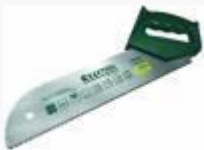
Ножовка KRAFTOOL "Multi-M" закал универс мелкий зуб U-RS, 11/12 TPI, 320мм

Ножовка KRAFTOOL "BLITZ" закал прямой зуб S-RL, 7/8 TPI, 500мм - применяется при распиле (как поперечном, так и продольном) заготовок из твёрдых и мягких пород дерева, средних и крупных размеров. Качеством ножовки KRAFTOOL серии "BLITZ" являются закалённые прямые зубья, общего назначения, имеющие двухстороннюю заточку (S - RS), что обеспечивает качество и скорость при работе с полотном в обоих направлениях. Эргономичная рукоятка,